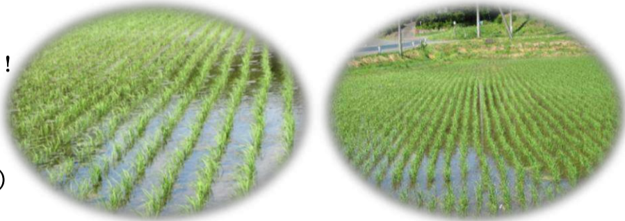
移植(田植え)した圃場は順調に成長(左:こがねもち・右:銀河のしずく)

今年は好天に恵まれたことから、春作業は予定した日程で順調に進みました。心配された水不足も一部の「沢田んぼ」を除きスムーズに作業が実施できました。水管理者の皆さんにはご苦勞をお掛けしたこと感謝申し上げます。引き続きご協力を！ ○代播き作業 4月27日～5月20日 ○移植:田植え作業 5月 2日～14日(こがねもち・銀河のしずく) ○種まき作業:直播栽培 5月 5日～25日(ひとめぼれ・つぶゆたか) ○その他 :WCS(ホールクローブサイレージ)はドローンで種まきを実施(つきはやか)