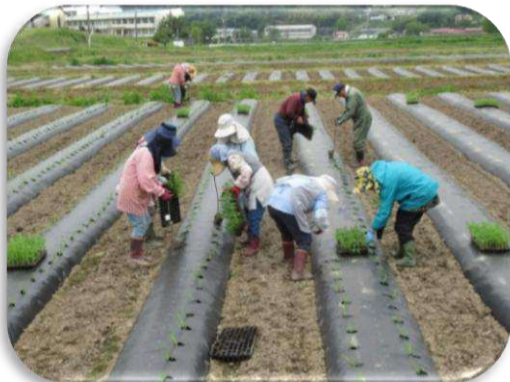
良く育った苗を皆で定植作業