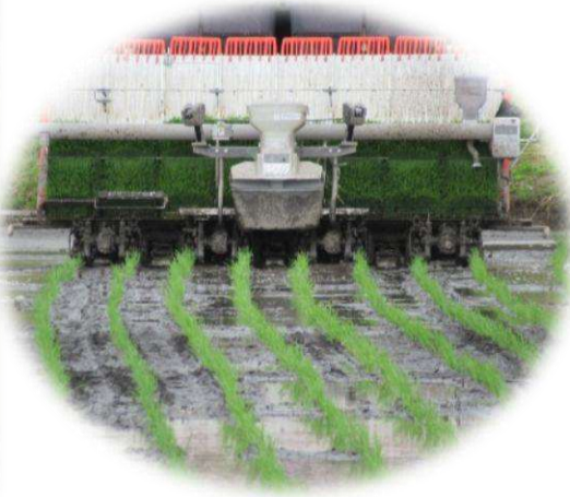
ちょっと曲がったかな？