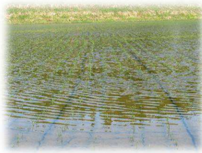
2葉期ほどになったら再び入水