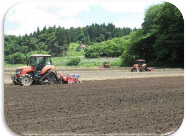
6/9より大豆播種作業開始