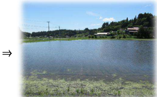
播種後は1週間ほど入水します。