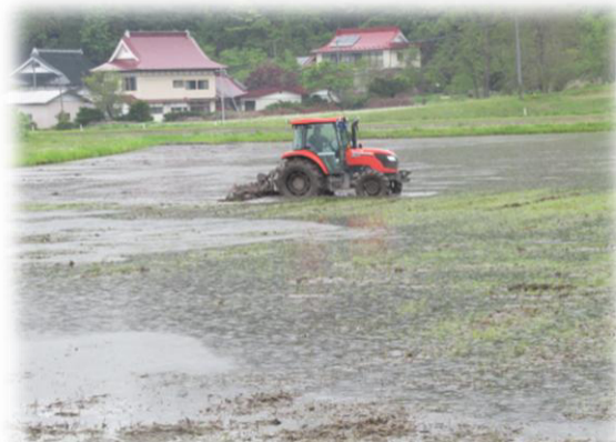
6台のトラクターで代播き作業も順調でした。(梨木洞前)