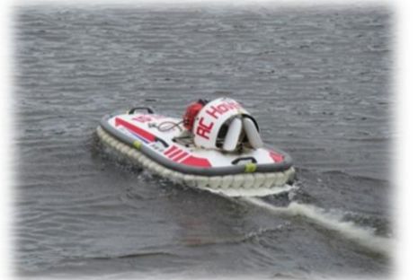
ホバークラフトによる除草剤散布