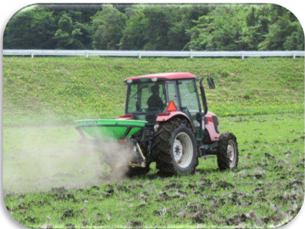
6/4ブロードキャストにより肥料散布を実施