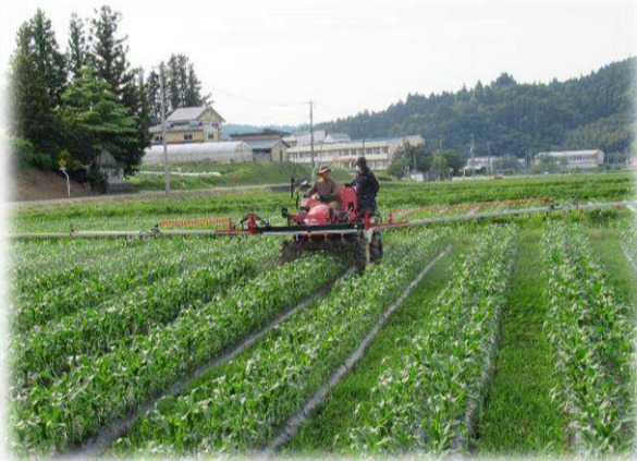
雑草も伸びてきたので除草剤散布を実施