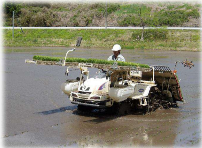
「銀河のしずく」の田植え作業(金取沢)