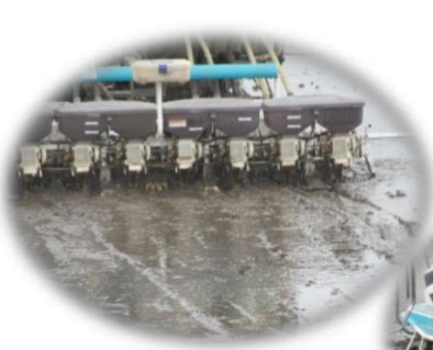
苗供給と違い種子補給なので人手はかかりません。