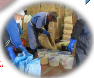
6/5 大豆種子の消毒実施