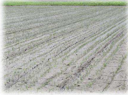
その後、発芽促進のため落水