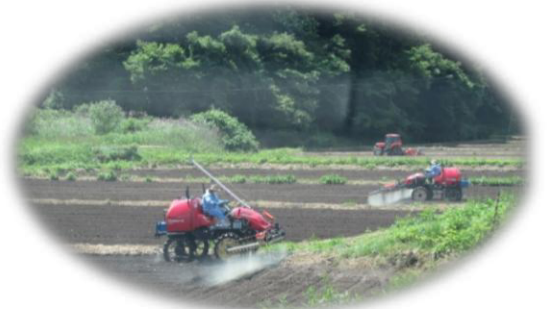
播種後は除草剤散布