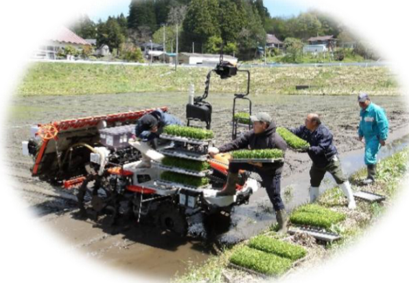
力を合わせ、苗の積込作業！