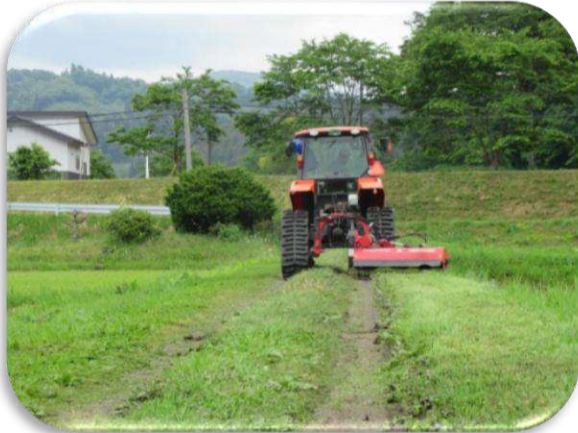
今年は草の伸びが早いようです。