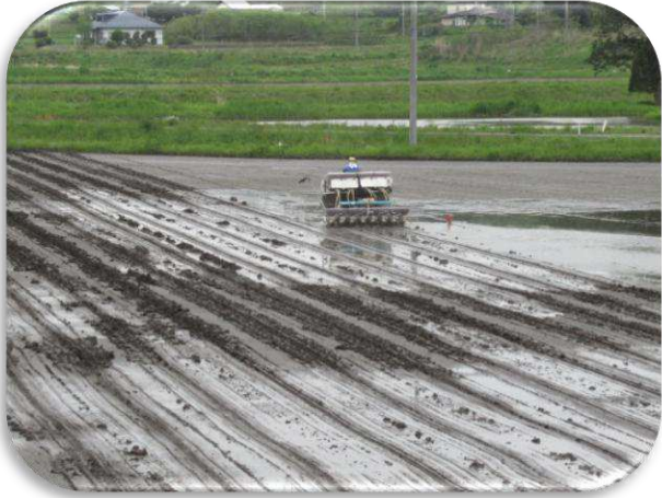
播種機により種まき作業を実施

ひとめぼれ 61.3ha、つぶゆたか 69.4ha、WCS9.2ha を直播栽培で取組み(田んぼに種で播く栽培)