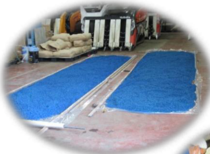
紫斑病対策と鳥除け対策のため種子消毒を実施 毒々しい色になりました。