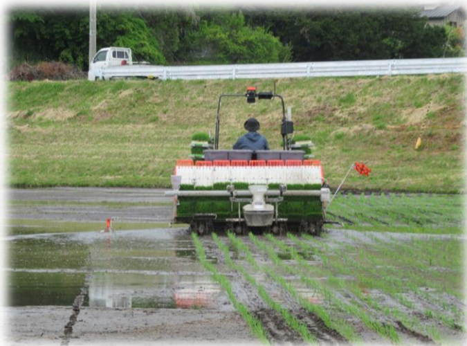
「こがねもち」の田植え作業(上川原)