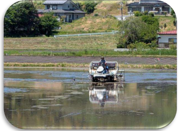
ちょっと水多かったかな！