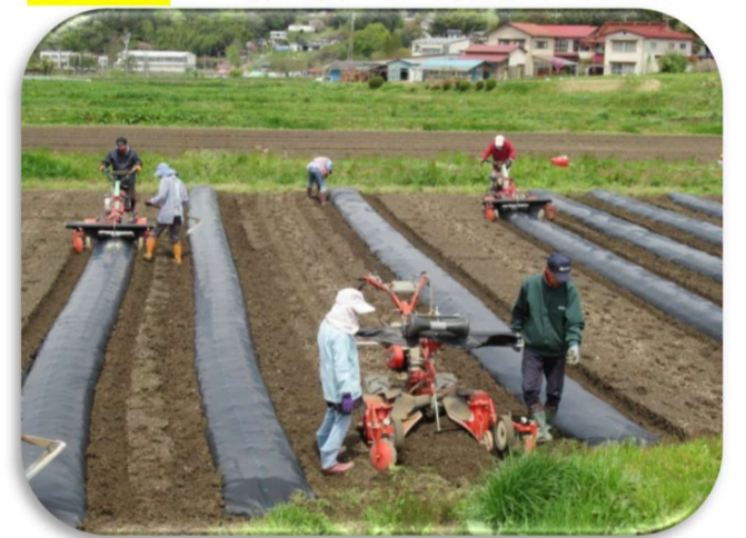
とうもろこし圃場ではマルチかけを実施