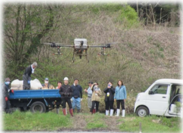
ドローンによる種まき作業（WCS圃場）