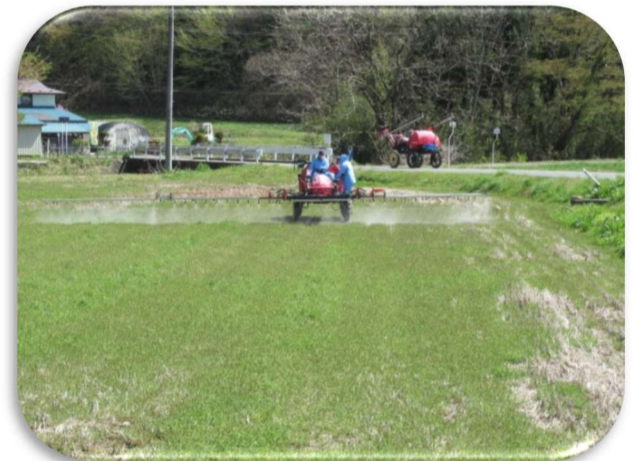
大豆圃場では耕起前の除草剤散布を実施