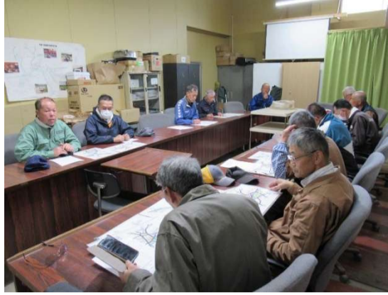
作業前には安全講習会・図面での圃場を確認