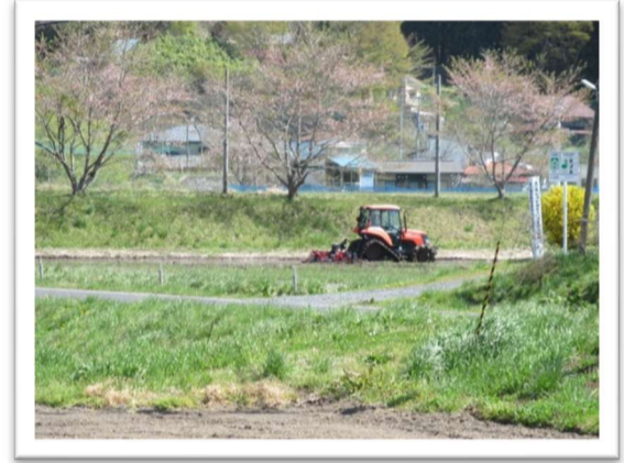
『桜と代掻き』 桜は散り始めですが・・・