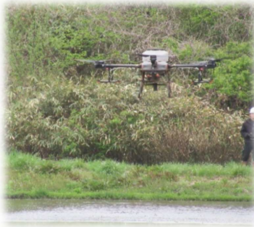
市・県の皆さんが多数視察に来ました。