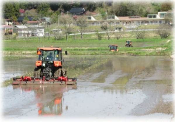
代掻き作業も開始されました（写真はWCS圃場）