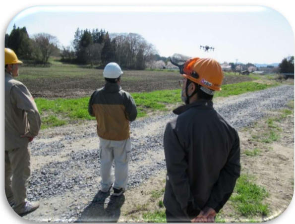
ドローンオペレーターの養成講習会開催