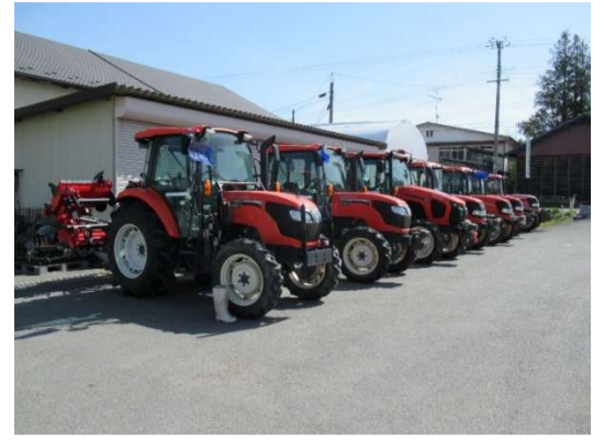
耕起・代掻きに向けトラクターの準備 OK