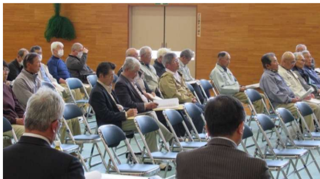
出席した組合員の皆さん