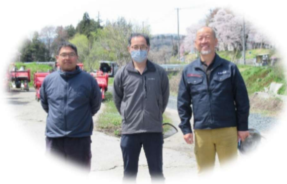
3名が取得、夏には活躍が見られます。