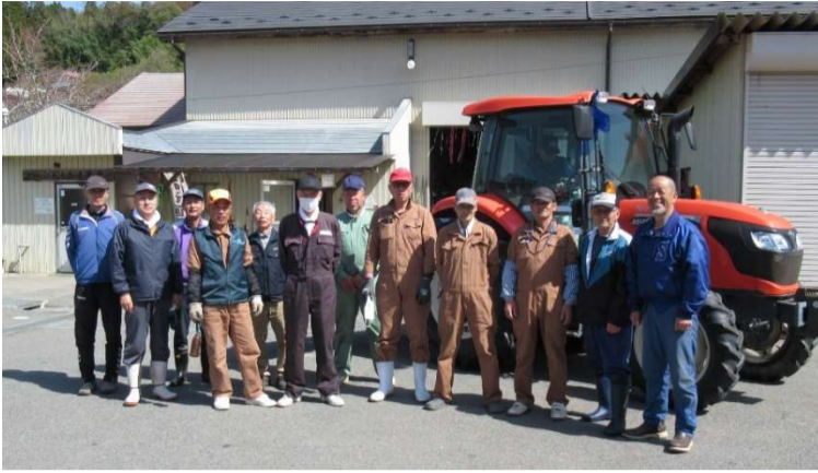
オペレーターの皆さん、安全作業をお願いします。

農業機械の整備、圃場の補修作業や用排水路・ため池の点検、畔塗り作業や土壌改良剤散布など進めてきましたが4月に入り、いよいよ本格的に耕起・代掻き作業、種まき（直播栽培）や田植え作業（移植栽培）が始まりました。